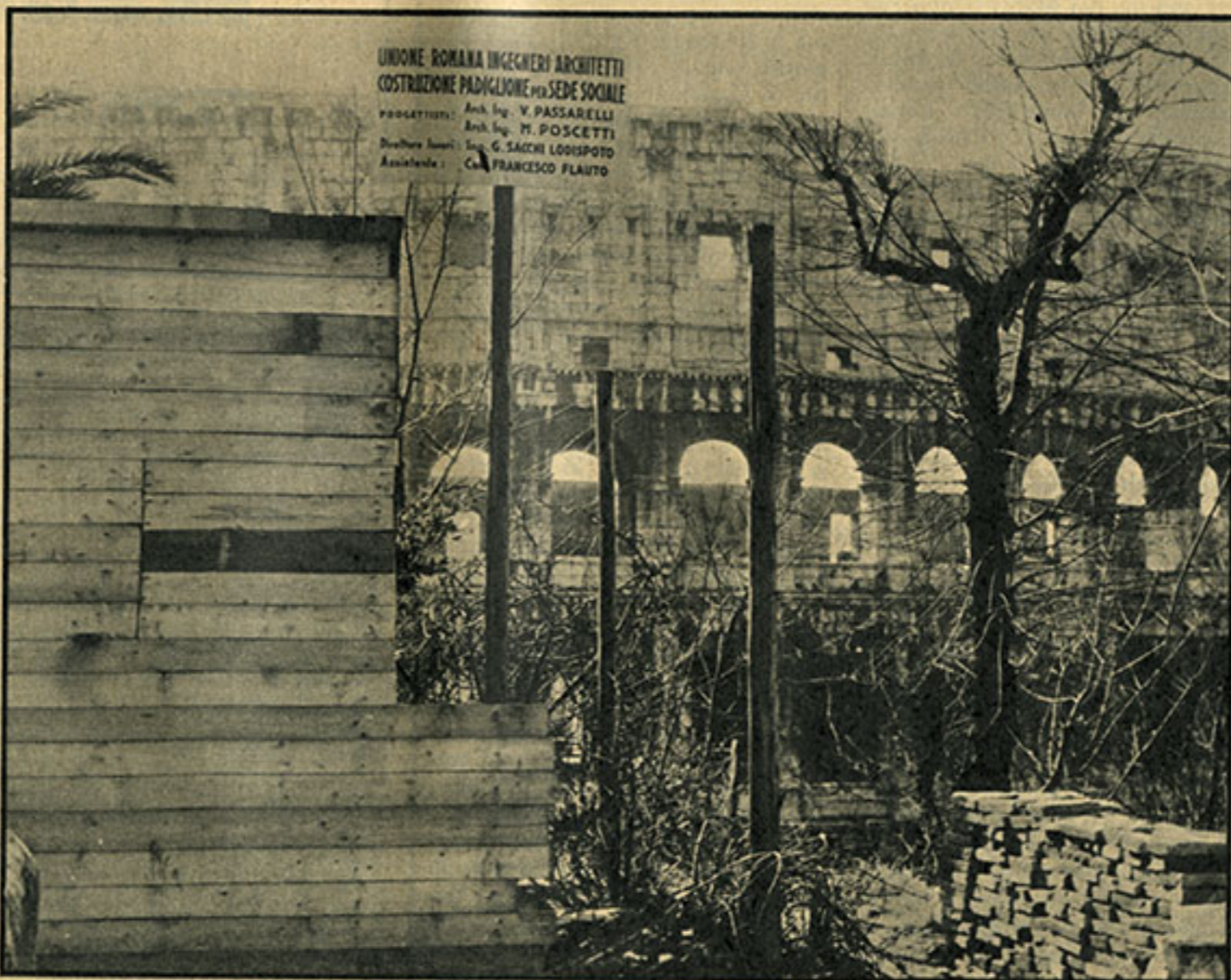
Roma 1956. Di fronte al Colosseo, in zona destinata a parco pubblico, gli architetti e ingegneri romani costruiscono la loro sede sociale.

Un fatto solo basta a mettere in evidenza il malgoverno di cui soffrono i monumenti romani: l'area dove pretendeva sorgere la panoramica sede sociale dell'Unione ingegneri e architetti è destinata, da un piano particolareggiato del