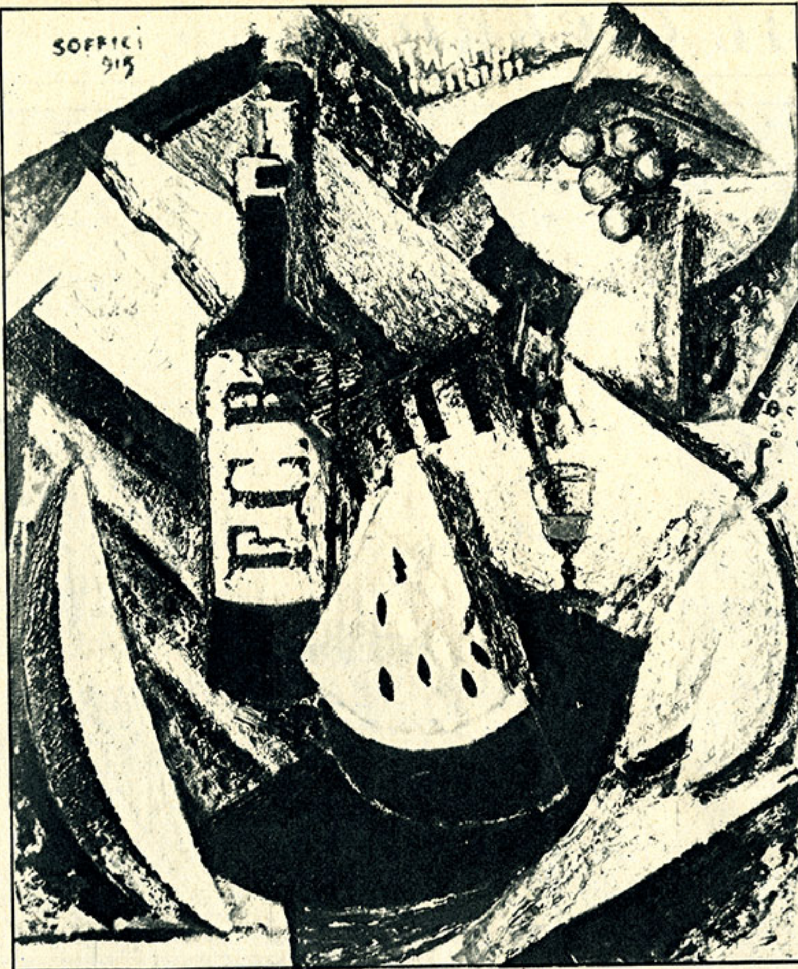
Roma. La pittura del periodo 1910-30 alla Quadriennale. Soffici: «Frutta e bottiglia» (collages):

Non ci regge l'animo di insistere oltre. Forse nemmeno ai tempi in cui la maggioranza dei dantisti del Giornale d'Italia amerebbe ancora vivere, ci fu dato assistere a una cruzione altrettanto pestifera di tronfia insensatezza. La nostra cultura ufficiale (e gli ingenui cretini che ne sono vittime) è dannata a portare fino in fondo il suo peccato originale, la sua vocazione aulica, accademica, decorativa. Quanto più seri sono i problemi del nostro Paese, tanto più grossolani, falsi e deformi sono gli orpelli con cui essa cerca di nasconderli, di eluderli, di ignorarli. Suo compito è profanare tutto quanto di grande, di puro e di civile essa tocca, grazie al suo immarcescibile istinto barbaramente rievocatore e orgiasticamente celebrativo: come già la romanità venne stravolta per gli ignobili fini della propaganda littoria, così oggi la iattura colpisce Dante, sul quale per di più impendono minacce di santificazione: eccolo in procinto di essere impagliato, congelato, degradato a simbolo stupido, a spaurac-