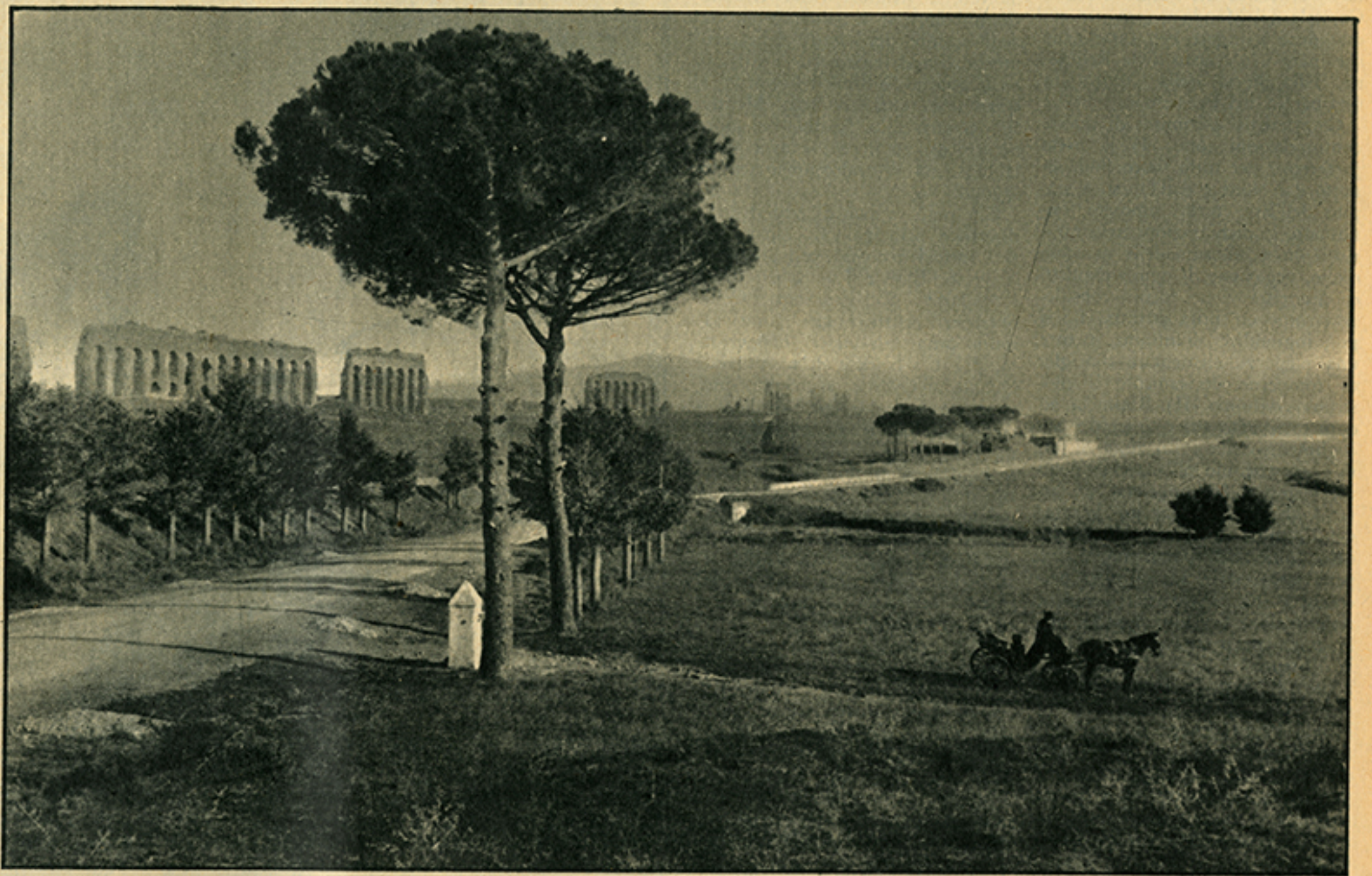
Un tratto della campagna romana all'inizio del secolo.

M ENTRE tutti dormiamo, in Campidoglio si lavora, e le fatiche preparatorie per il nuovo piano regolatore di Roma sembrano avvicinarsi a una conclusione. Dopo un anno di segrete manovre, siamo entrati nella fase finale, quella dell'affannosa (e sempre segreta) ricerca di un compromesso qualunque tra le contrastanti opinioni che si sono venute via via manifestando: con ogni probabilità, quando il grande annuncio sarà fatto, ci accorgeremo che l'ultima occasione per impostare seriamente gli sviluppi futuri dell'eterna città, è andata perduta.