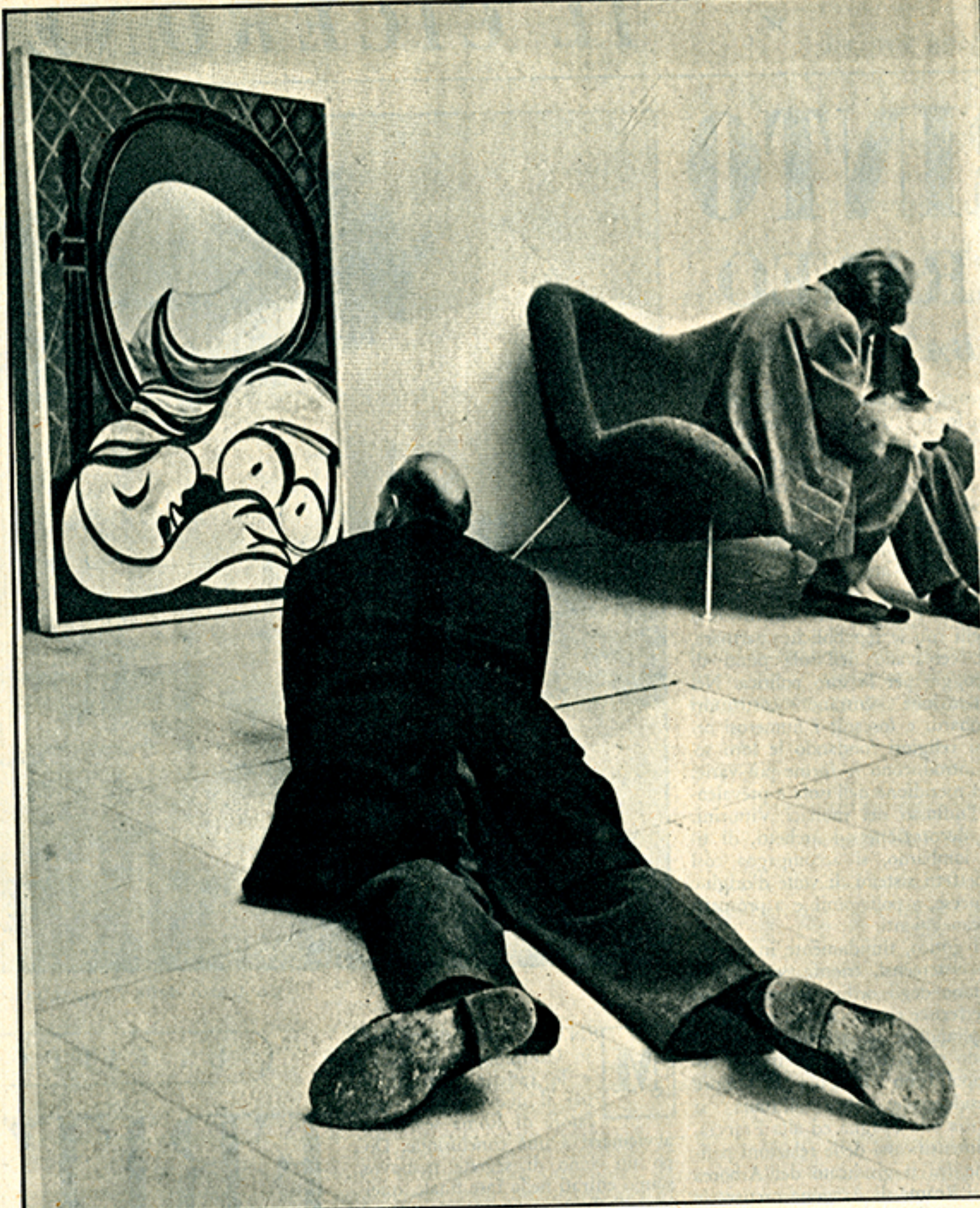
Monaco. Un visitatore esigente all'esposizione di Picasso.