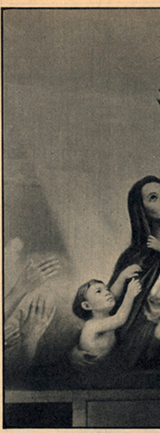
Pittura sacra in America. Nuove

Intanto vanno sparendo parecchie aree ancora libere intorno al centro: un quartiere di ville di una certa pretesa sorge nell'ansa verde del Bacchiglione a Nord (un ammasso di bugne, archi, verande, porticati, ecc., in uno stile classico-sepolcrale che mette il gelo addosso); già si sta costruendo sulla riva destra del Retrone (per chi guarda dal Ponte della Ferrovia), da cui fra l'altro finora si godeva una delle più belle vedute della città; e da tempo si va colmando, del medesimo fiume, la riva presso il viale Margherita; di costruzioni si va riempiendo la zona di contrada Mure Pallamaio; già è stata approvata la costruzione di tre o quattro grattacieli, dell'altezza di 30-32 metri in viale Milano, per bloccare a occidente la città e stringere sempre più dappresso Campo Marzo; un grattacielo si vorrebbe costruire