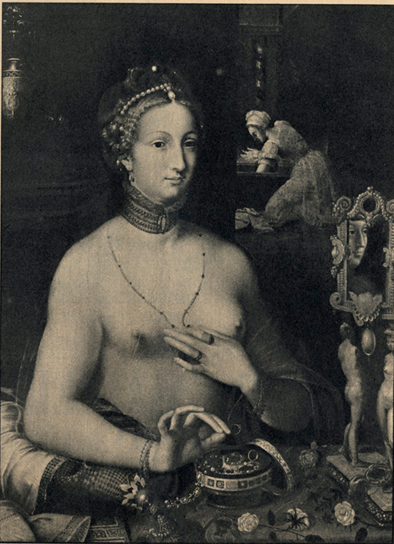
François Bunel Il giovane: « Signora alla sua toilette ». (Mostra del trionfo del manierismo europeo, sotto il patronato del Consiglio d'Europa).