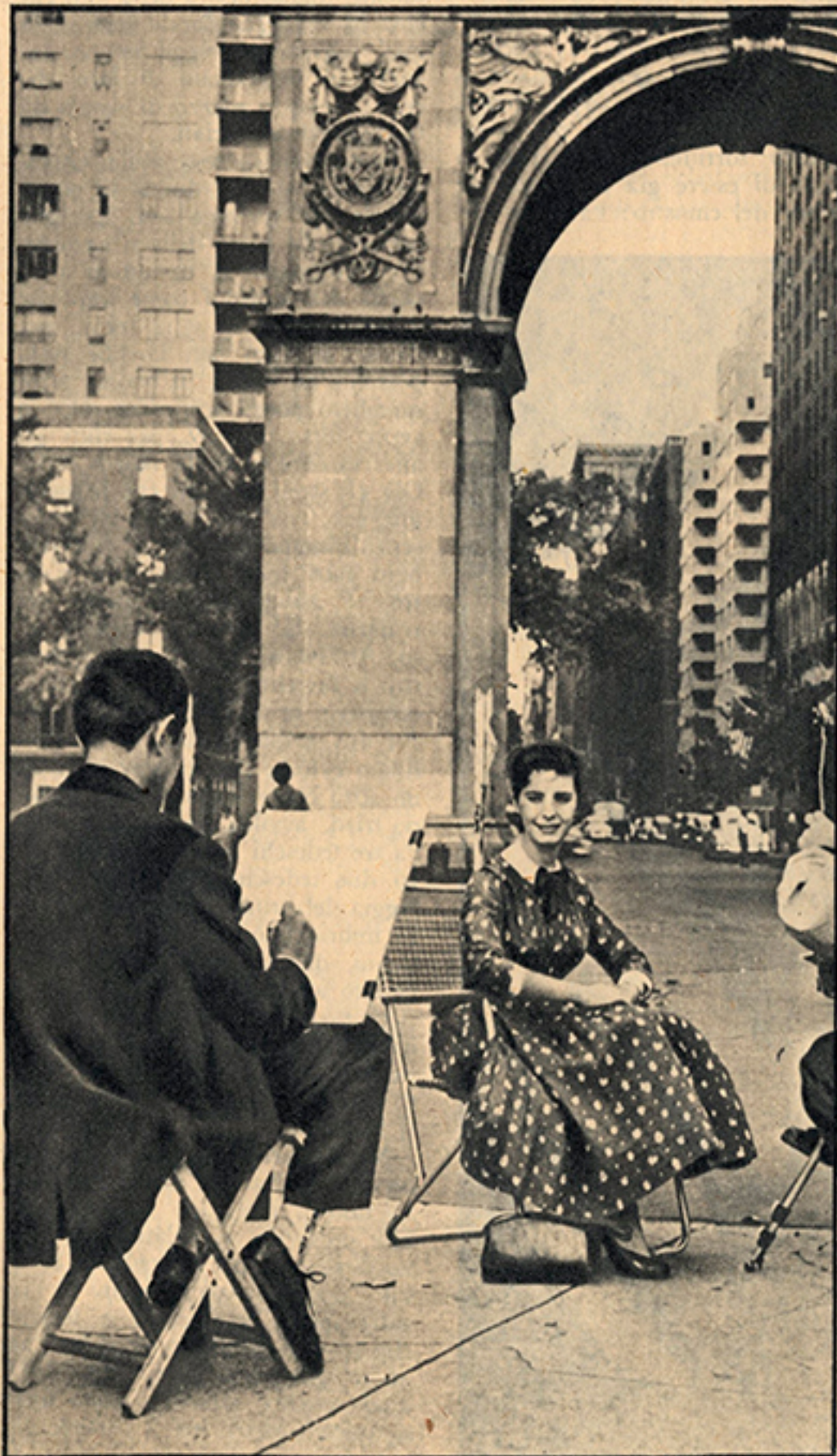
New York. La giovane attrice Margaret O'Brien si presta come modello in Washington's Square.