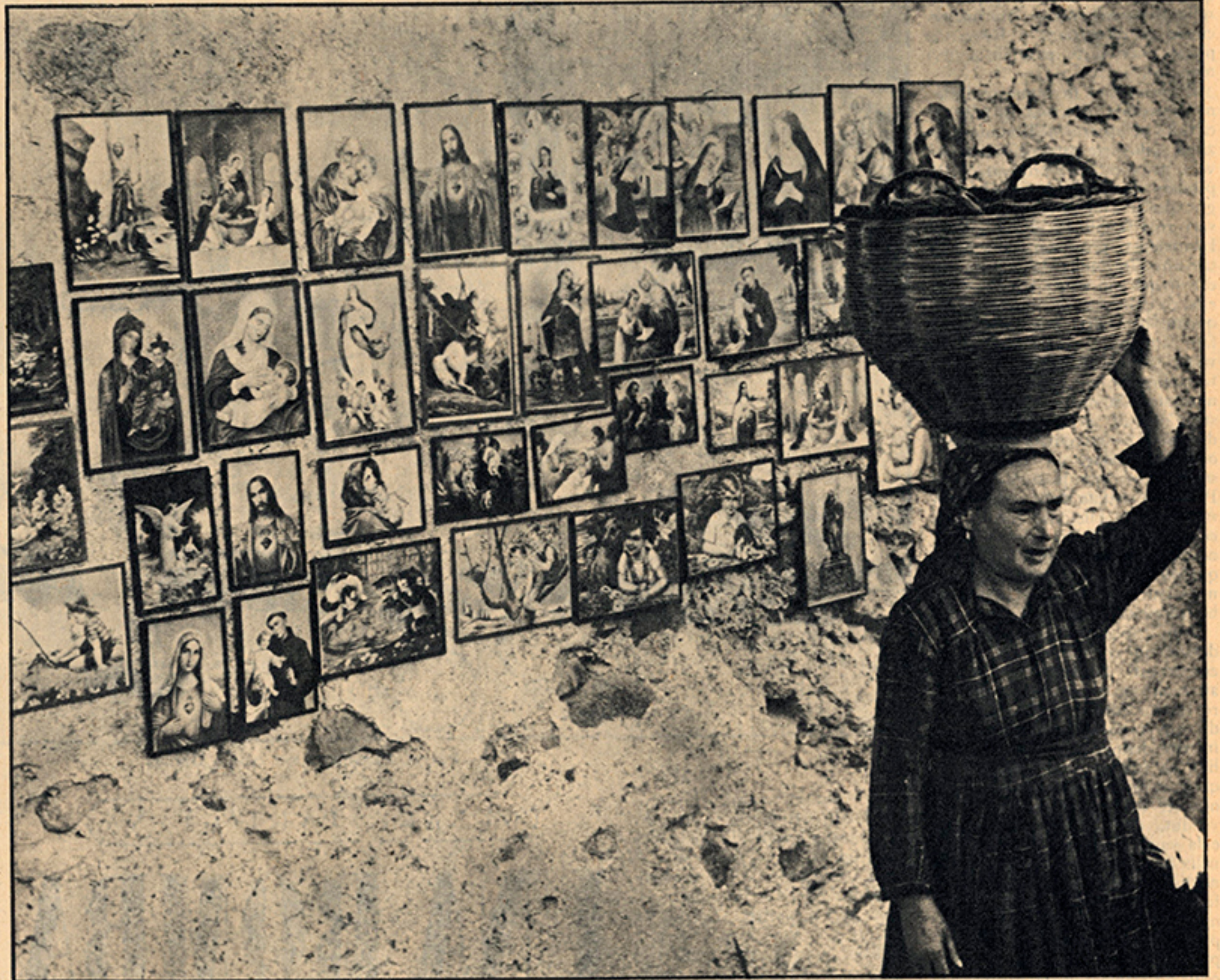
Scene della vita di provincia. Arte sacra e profana.