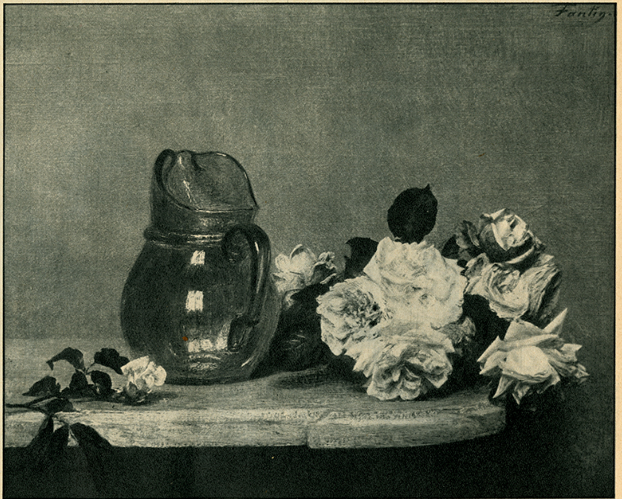
Roma. Mostra dei capolavori dell'800 francese. Fantin Latour: « Rose e caraffa blu ».