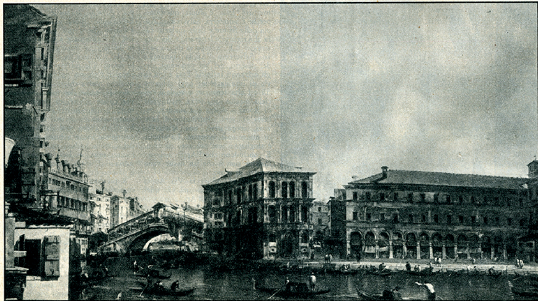
Francesco Guardi: « Il Canal Grande ». (Collezione di Lord Iveagh, Londra).