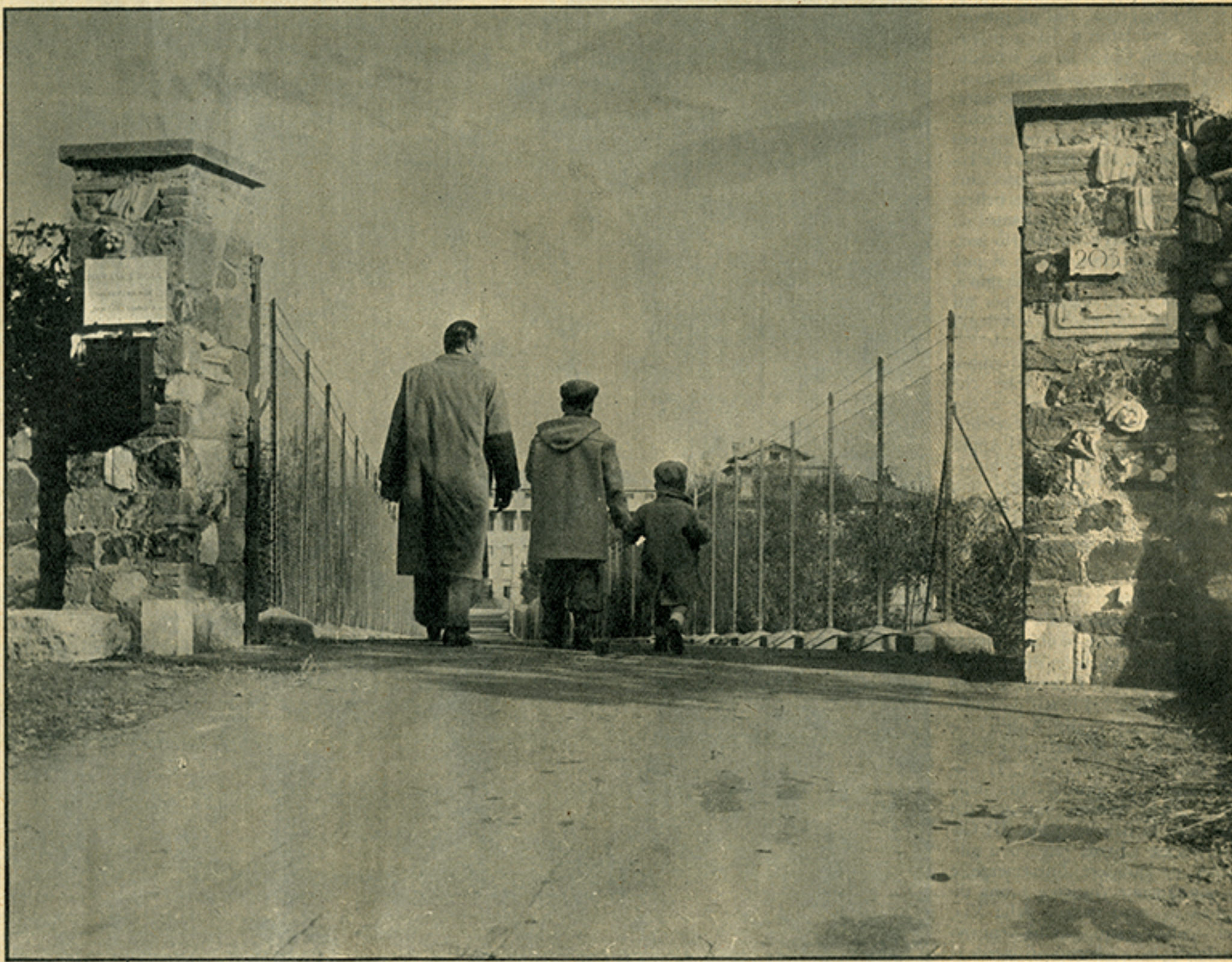
Roma. Via Appia Antica: Ingresso della Pia Casa Santa Rosa con i pilastri moderni cosparsi di frammenti antichi.

DEFINIZIONI storiche: «Il nuovo di Matisse sull'impressionismo fu dunque di mettere al centro mentale del dipinto un colore invece di una forma...» (Da un articolo del Prof. Roberto Longhi: «Matisse portò gli stupefacenti nella pittura»).