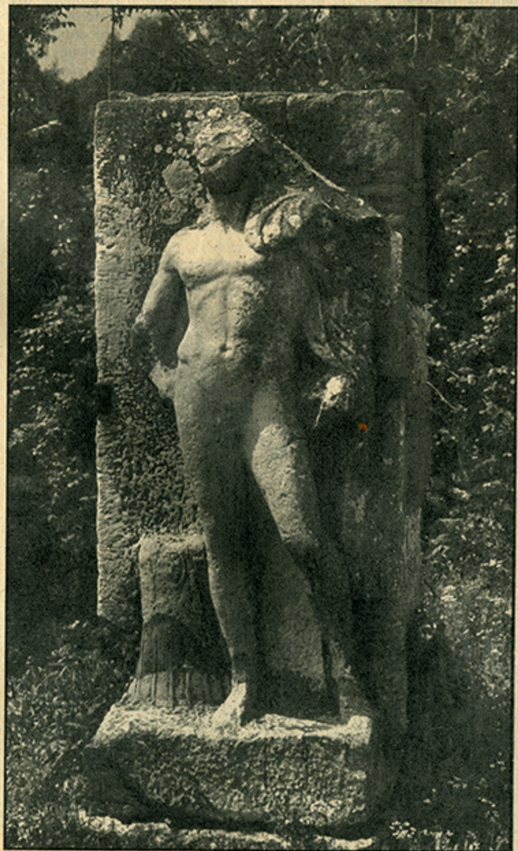
Roma. Via Appia Antica: Scultura romana su una tomba al quarto chilometro.

Ma gli «esperti» del Giornale d'Italia amano soprattutto venire a noi in veste di filosofi. Si sono creati su misura una specie di storicismo per mezze calzette, per cui tutto è relativo e tutto si giustifica,