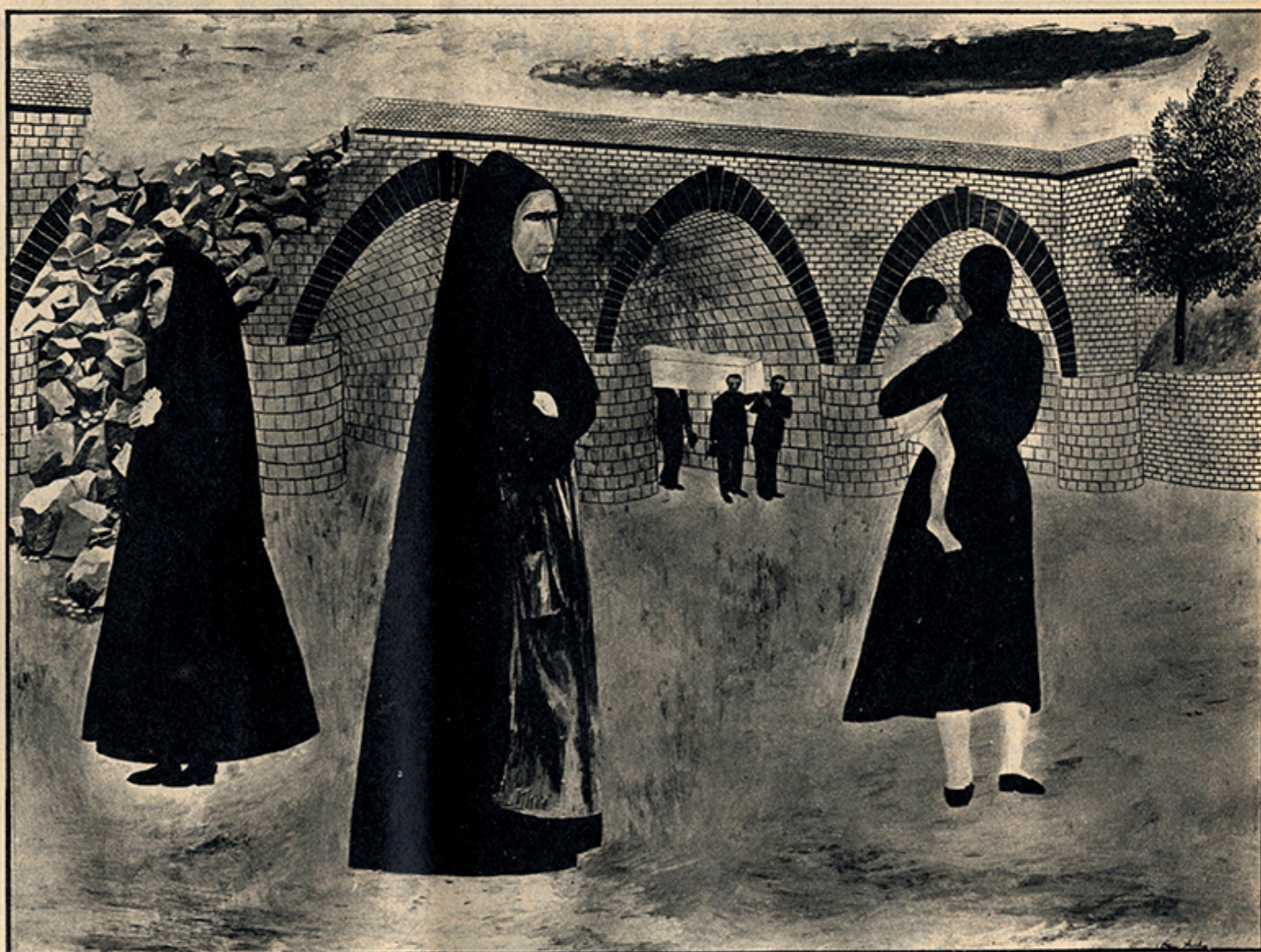
Venezia. « Paesaggio italiano » di Ben Shahn, alla Biennale.

Archeologi, romanisti, architetti, restauratori, sventratori e urbanisti, hanno sempre avuto la fissazio-