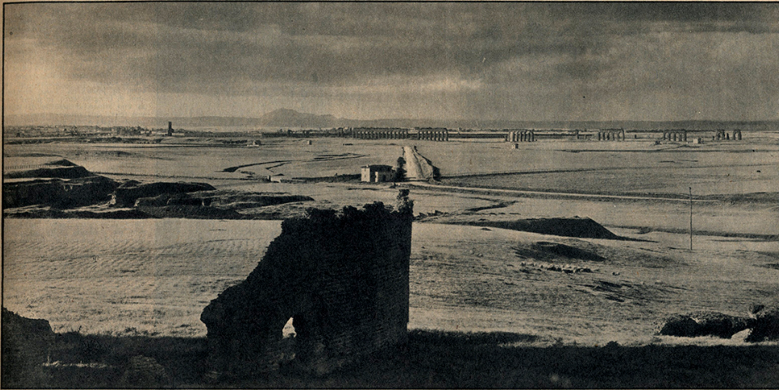
Roma - Via Appia Antica. La campagna romana e i ruderi della Villa dei Quintili sulla fine dell'800.