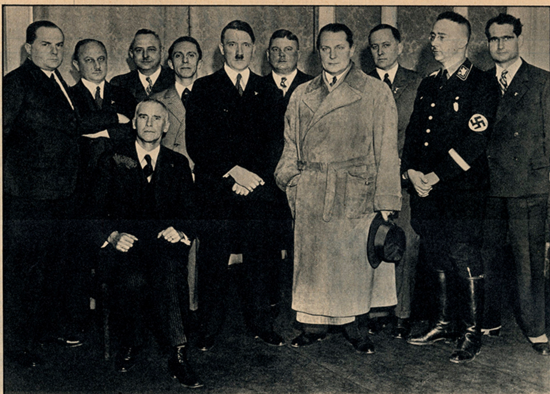
Berlino, 3 gennaio 1933. La prima fotografia di Hitler appena nominato Cancelliere. (Tra i collaboratori si notano, da sinistra a destra: Goebbels, Roehm, Goering, Himmler, Hess, Frick).