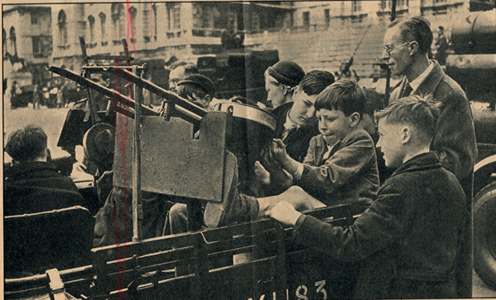
Londra. Come si divertono i bambini.