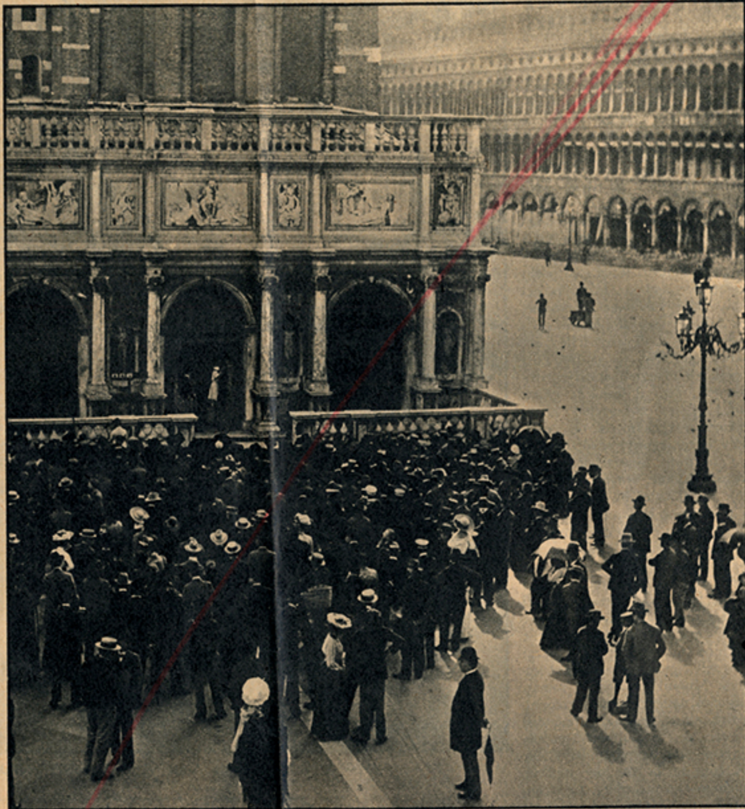
Venezia, 1900. L'estrazione del Lotto alla loggetta del Sansovino. Due anni dopo (2 luglio 1902) crollava il vecchio campanile di San Marco.

★ GLI ISCRITTI alla sezione italiana dell'Associazione Internazionale dei Critici d'Arte si sono riuniti recentemente a Roma per discutere lo statuto del loro organismo. Durante una colazione offerta dal Turismo, l'on. Romani ha brindato al successo della campagna per la difesa del paesaggio promessa da scrittori e artisti. Il Commissario del Turismo ha annunciato che sono in corso dei provvedimenti per eliminare intanto i cartelloni pubblicitari dalle strade nazionali.