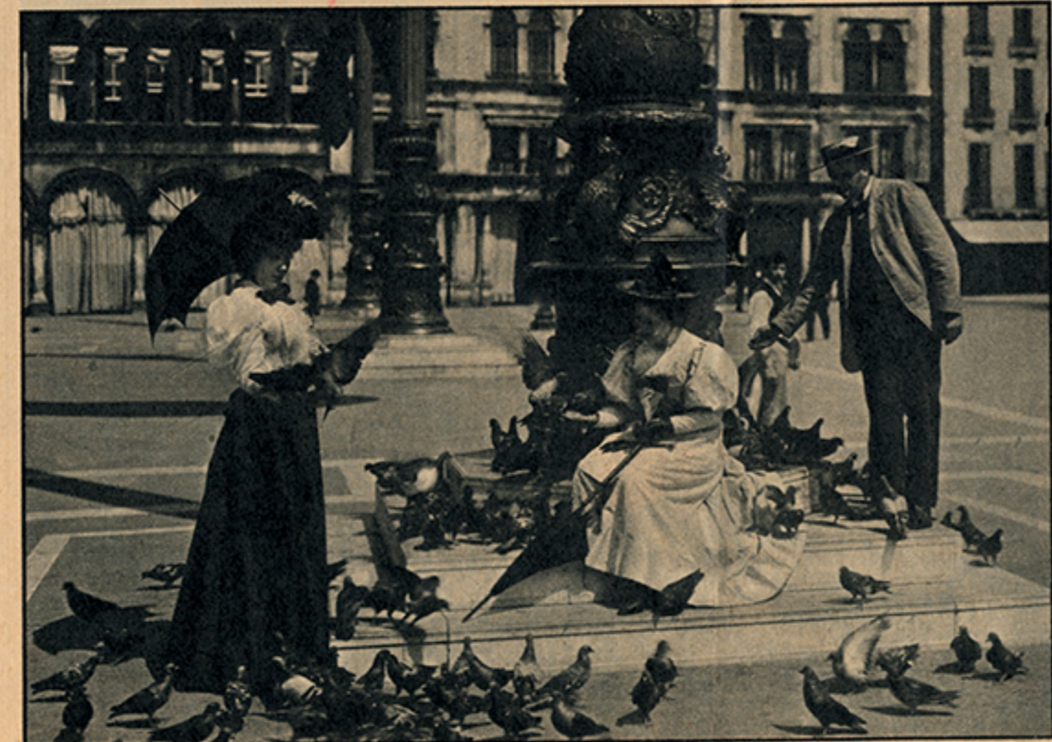
Venezia. I turisti del 1900.

Che sul Canal Grande nessuno debba demolire e ricostruire, nè in bene nè in male, ce lo conferma la debolezza degli altri argomenti addotti dai wrightiani. Essi dicono che, siccome anche gli antichi, dai paleocristiani ai neo-classici, hanno ininterrottamente distrutto e ricostruito, ecc., così anche noi dobbiamo distruggere e ricostruire. Noi ragioniamo esattamente al contrario: gli antichi sono dei pessimi maestri. Nel Medioevo hanno annientato meravigliosi monumenti classici, nel Rinascimento hanno annientato meravigliosi monumenti classici e medioevali, nei secoli seguenti hanno annientato meravigliosi monumenti classici, medioevali, rinascimentali e barocchi. Gli antichi (e sempre e soltanto per ragioni di ignoranza o di economia) hanno ridotto in calce migliaia di statue greche e romane, hanno cotto nelle fornaci montagne di templi, palazzi e sepolcri, hanno polverizzato sconfinata distese di mosaici e di affreschi, hanno stritolato giganteschi monumenti che sembravano destinati a durare eternamente, dal Circo Massimo al Settizonio, dalla basilica vaticana al palazzo del Laterano, favoloso museo di arte cristiana, caduto sotto Sua Maestà il piccone di Sua San-