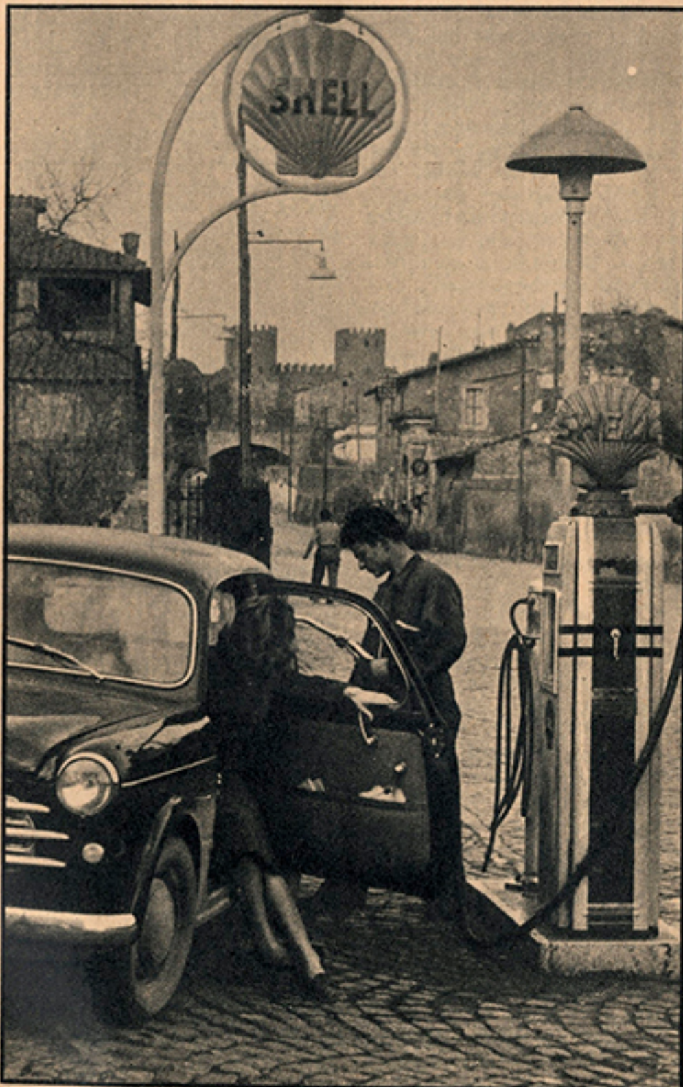
Roma. Via Appia. La benzina sul monumento

NELLA CRONACA artistica della settimana scorsa, intitolata « Realismo su misura », si cita come di Fra Galgario un quadro dell'Accademia Carrara di Bergamo (Ragazza con ventaglio) che fino a pochi anni fa era catalogato sotto il nome di Pietro Longhi, e ora viene incluso nel catalogo di Ceruti detto il Pidocchietto. Resta inteso che non si tratta di una nuova proposta di paternità, ma di un banale lapsus, che il lettore è pregato di rettificare.