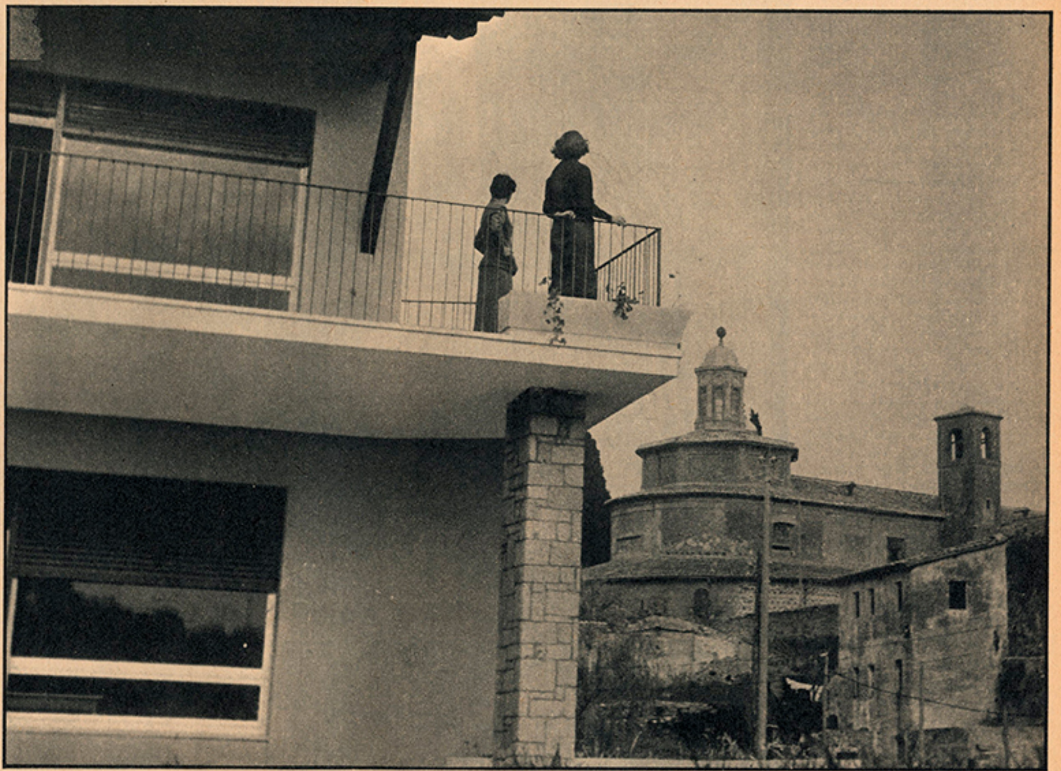
Roma. Via Appia. La casa sulla Basilica.