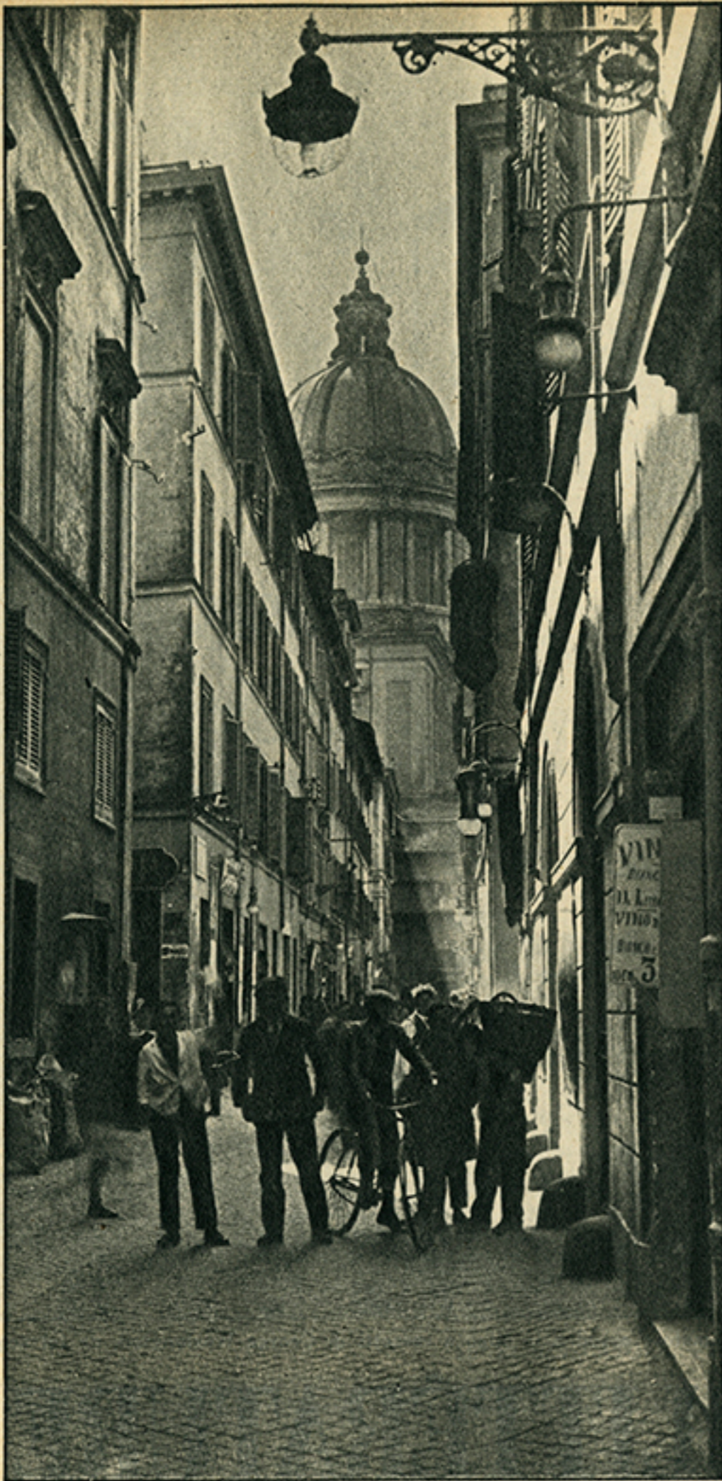
Roma, 1920. Via delle Colonnate.

Via Vittoria. N. C. dice che i suoi edifici sono di «un'estrema