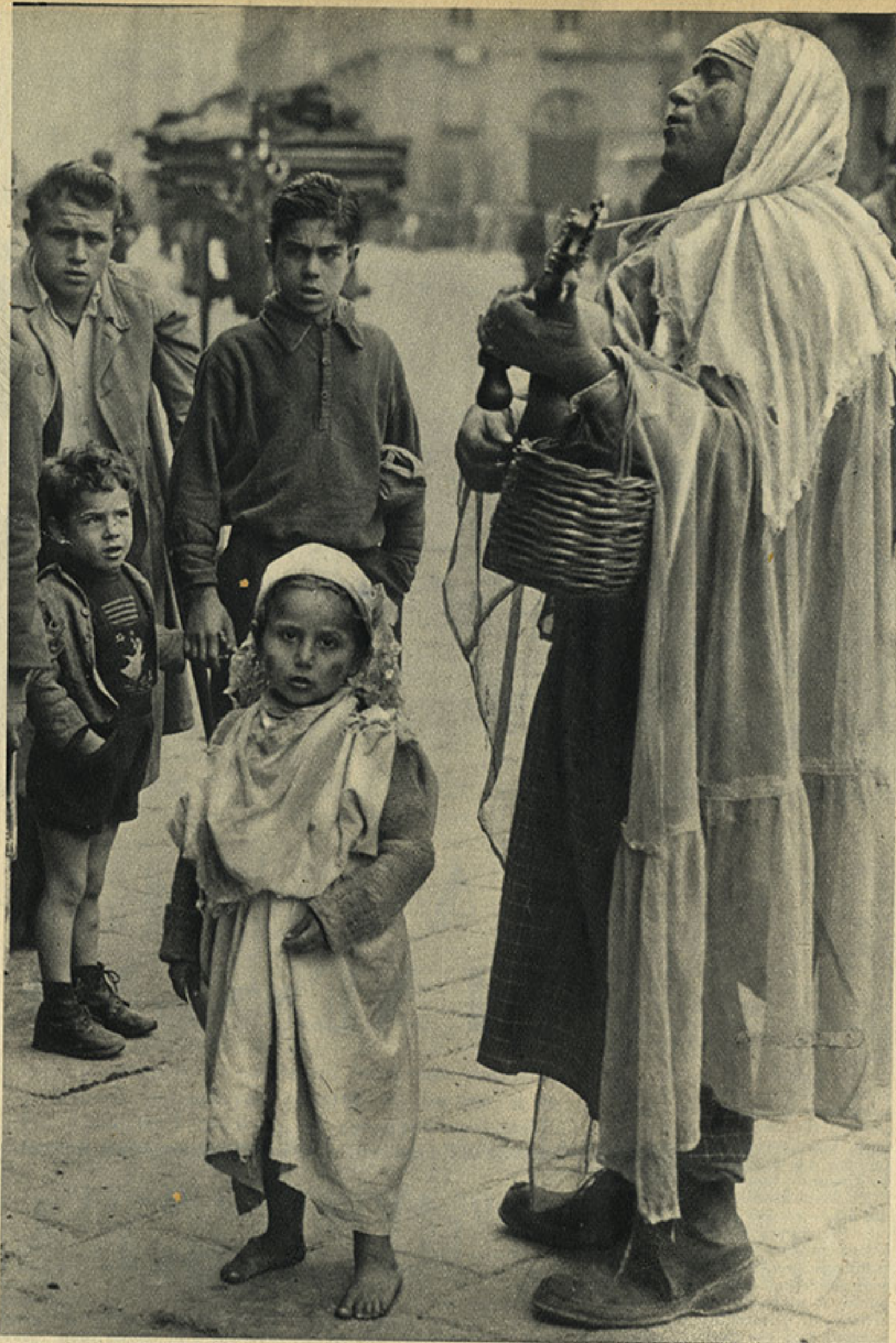
Napoli. Il cantastorie.