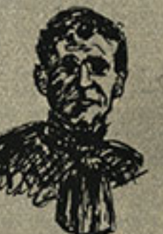
Don Bosco di Giuseppe Molteni Uno degli spiriti più felicemente dotati e ricchi dell'umanità, che il nostro popolo ha espresso in questo secolo.

Biografie di uomini moderni che con la loro volontà ed il loro ingegno giunsero all'attuazione di un alto compito civile e morale, alla realizzazione di scoperte, esplorazioni, fondazioni industriali e benefiche. Vite poco note e degne tuttavia di servire d'esempio.