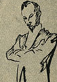
L. V. Bertarelli di Irillo Bianchi Il fondatore del Touring, l'italiano che, per amor della sua terra, seppe diventare esploratore, geografo, scrittore, organizzatore.