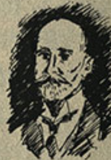
Giuseppe Colombo di Vittorio Nivellini Il papà degli ingegneri italiani, primo elargitore della luce elettrica in Italia, figura esemplare di educatore, scienziato e uomo politico.