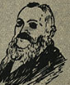
Ferdinando Bocconi di Ciro Poggioni Mercurio in finanzia; l'ideatore in Italia di un commercio di vasto respiro, il fondatore della prima Università commerciale italiana

* Ogni volume Formato 11,5 x 16,5 illustrato e rilegato L. 300