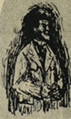
Giulio Ricordi di Giuseppe Adams L'amico dei musicisti italiani. Il collaboratore fedele ed entusiasta di Verdi, Boito, Puccini, Mascagni.