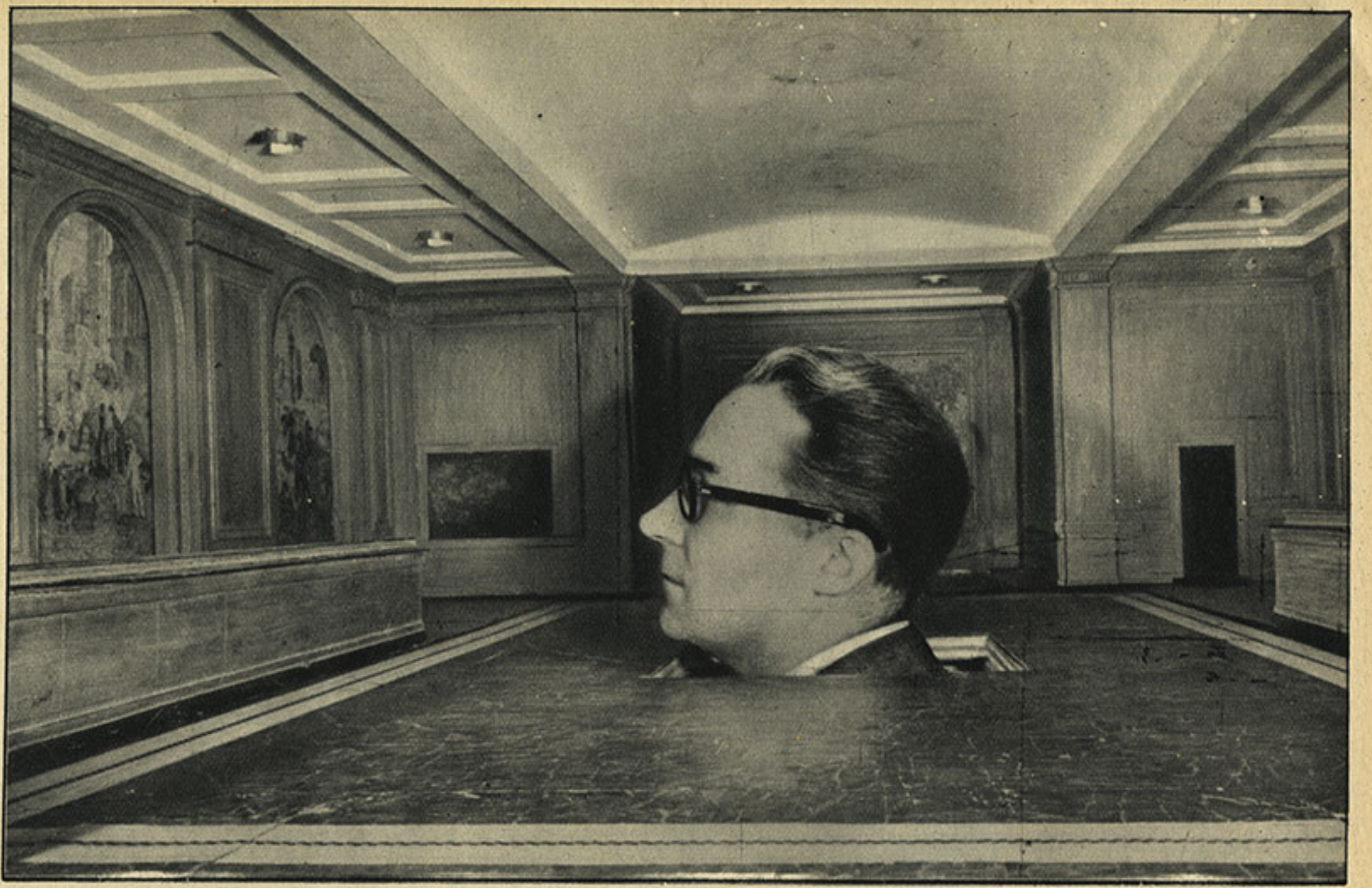
Il sogno del congressista è di invadere i musei.

Meno liberale è stata, finora, la sfida di Dostoevski. Di solito si ama vedere in lui l'artista e si trascurano quelle sue idee politico-religiose, che, a detta del Masaryk